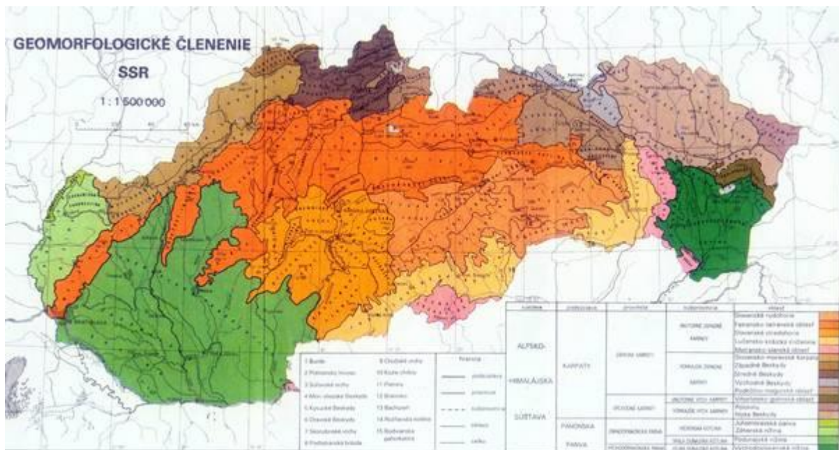
Obr. 1 Prehľad vyšších geomorfologických jednotiek

(Členenie bolo publikované o. i. aj v Atlase SSR (Bratislava: SAV; SÚGK, 1980, s. 54-55) a mierne upravené v Atlase krajiny Slovenskej republiky (Bratislava: MŽP SR a Banská Bystrica: SAŽP, 2002, s. 88).