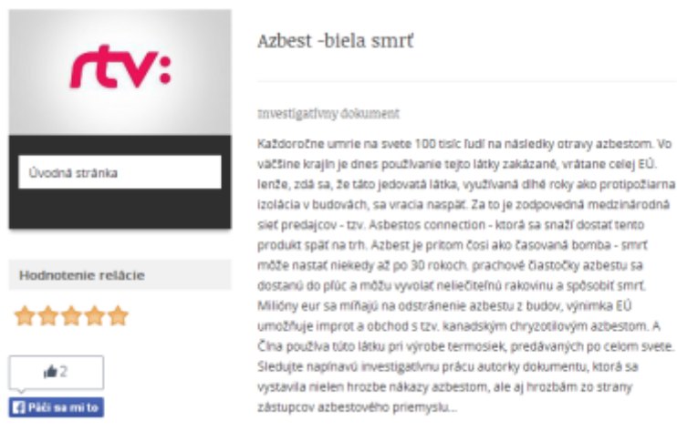
Obr. 1. Fragment internetovej stránky RTVS, s textom komentujúcim filmový dokument „Azbest – biela smrť“, ktorý bol vysielaný v októbri roku 2014.

Prvé tri informácie možno hodnotiť ako úplne nesprávne, pretože azbesty neobsahujú žiadne toxické látky. Ich hlavnou zložkou sú rôzne silikátové minerály tvorené najmä prvkami kremíka, kyslíka, hliníka, vápnika, horčíka, železa a sodíka. Všetky zdravotné riziká spojené s azbestom súvisia s vláknitým alebo ihličkovitým tvarom týchto minerálov, ich veľmi malým priemerom, morfológiou a fyzikálno-chemickým charakterom ich lomových plôch, a zároveň ich veľmi nízkou rozpustnosťou v telesných tekutinách (teda úplne opačne ako u jedov). Výsledkom kombinácie týchto vlastností je veľmi obmedzená schopnosť organizmu vylučovať tieto minerály, vďaka čomu trvale poškodzujú rôzne tkanivá, zväčša však tkanivá pľúc a zažívacieho traktu.