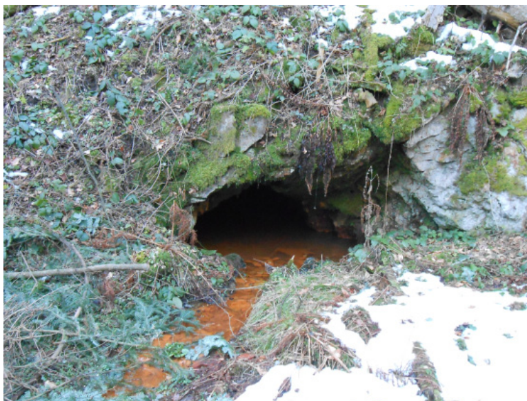
Ústie štólne Kýzová.

Lokalizácia starých banských diel sa najčastejšie opiera o prítomnosť hlušínových odvalov – hald. V prípade, že banské dielo nemá prislúchajúci odval, alebo tento v priebehu času zanikol, možno využiť metódu, ktorá spočíva vo vizuálnom štúdiu terénu v ktorom sa nachádza vodný tok vytvárajúci sieť mikropovodia. Spravidla sa dá zistiť miesto kde podzemná voda z opusteného banského diela vyte-